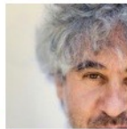
Tim Berne's Snakeoil en concierto: Exento de fraudes y engaños